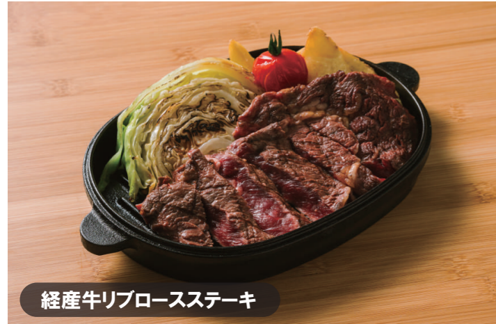
経産牛リブロースステーキ

●ステーキ(180g) ●アンチョビキャベツ ●季節野菜 ●フライドポテト 極上の食べごたえ、北海道産経産牛のジューシーなリブロースステーキを贅沢に180gを使用した 当店1番人気のプレート。