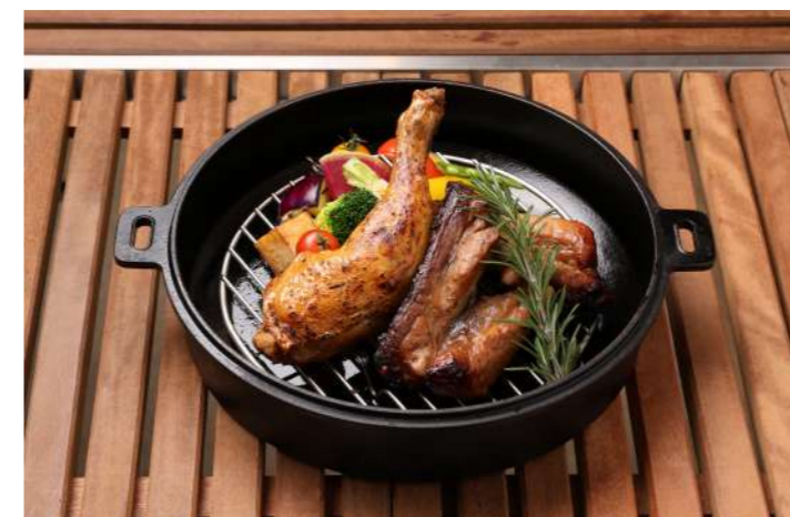
ローストチキン & BBQスペアリブ 3,460 (3,806)

+ ドリンク・サラダセット 480 (528) + ライス(十六穀米)セット 300 (330)