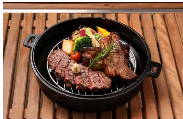
BBQスペアリブ & ビーフステーキ 3,860 (4,246)