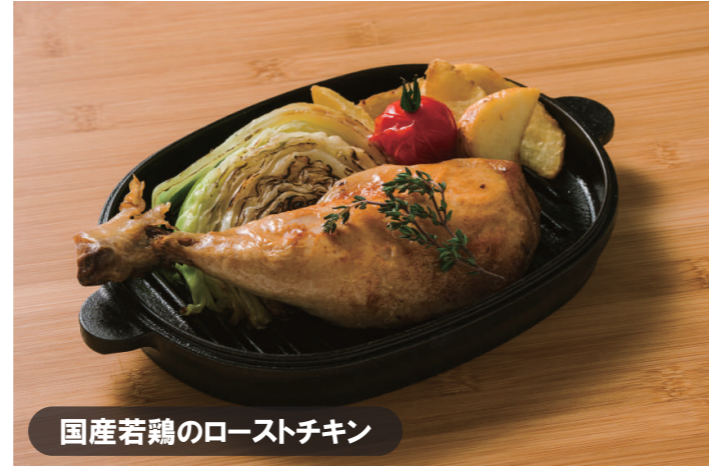
国産若鶏のローストチキン

単品 2,180 (2,398) + ドリンク・サラダセット 480 (528) + ライス(十六穀米)セット 300 (330)