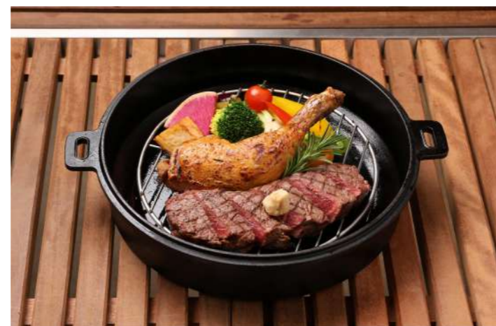
ローストチキン & ビーフステーキ 3,660 (4,026)