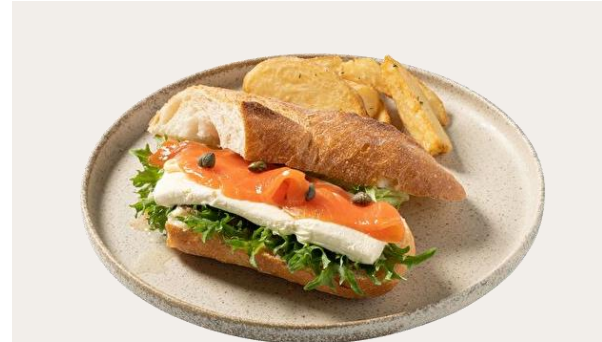
TAKE OUT OK Smoked salmon & Cream cheese sandwich

国産若鶏 ローストチキンランチプレート 1,780 (1,958) 国産若鳥の骨付きもも肉を数種類の香草でマリネし、オーブンでじっくりとロースト。骨付きもも肉の食べ応えをお楽しみください。 ※ライス・大盛りライス(+110)・バゲットから選べます。