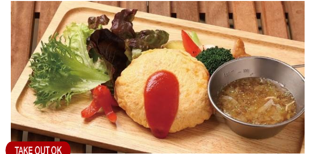
TAKE OUT OK キッズオムライスセット (スープ付き) 1,000(1,100) Kid's omelette rice