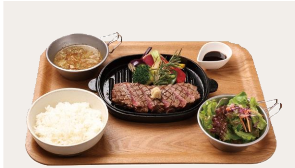
TAKE OUT OK Beef sirloin steak plate(Rice or Bread)

北海道産肥育牛 サーロインステーキプレート 2,200(2,420) ( 産経産牛の赤身肉の旨味をしっかりと感じられ、程よい肉質のサーロインを180g使用したステーキ。自家製ステーキソースをかけてお召し上がりください。 ※ライス・大盛りライス(+110)・バゲットから選べます。