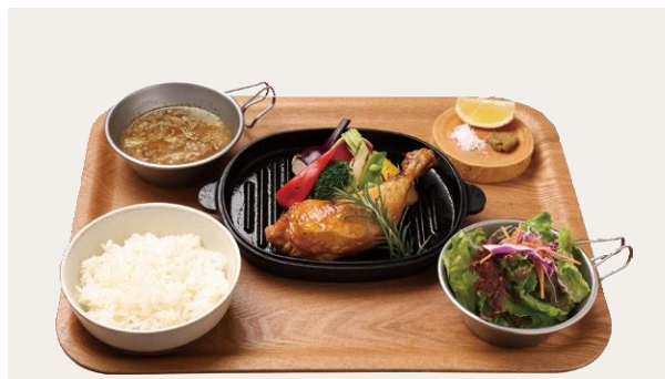
TAKE OUT OK Roast chicken lunch plate(Rice or Bread)

BBQスペアリブ プレート 1,880(2,068) スペアリブをじっくりと時間をかけ火入れし、しっとりと柔らかくジューシーに仕上げました。甘辛ソースでご飯との相性も抜群です。 ※ライス・大盛りライス(+110)・バゲットから選べます。