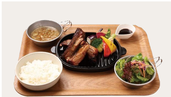
TAKE OUT OK BBQ pork spareribs plate(Rice or Bread)

北海道産肥育牛 サーロインステーキプレート 2,200(2,420) ( 産経産牛の赤身肉の旨味をしっかりと感じられ、程よい肉質のサーロインを180g使用したステーキ。自家製ステーキソースをかけてお召し上がりください。 ※ライス・大盛りライス(+110)・バゲットから選べます。