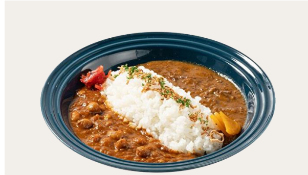
TAKE OUT OK 2 types of curry plate(Beef & Beans)

スモークサーモン&クリームチーズ サンド 1,680(1,848) (スープ・サラダ付き) スモークしたサーモンの塩味と旨味にクリームチーズのまろやかな美味しさを口いっぱいにはおぼせて、お召し上がりください。