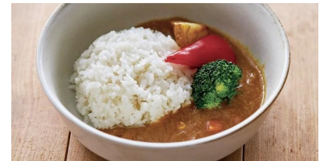
キッズカレー 700(770) Kid's curry