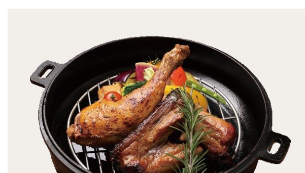
Roast chicken & BBQ pork spareribs