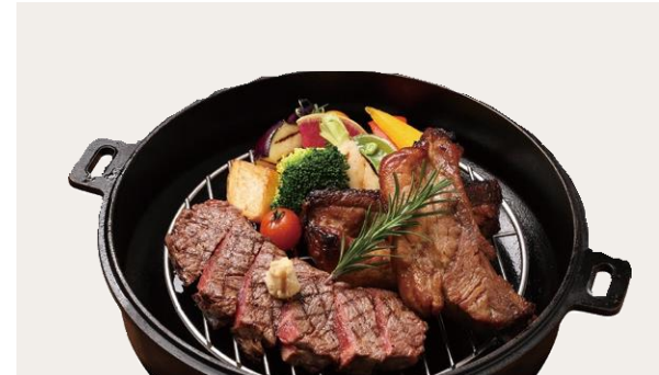
BBQ pork spareribs & Beef steak