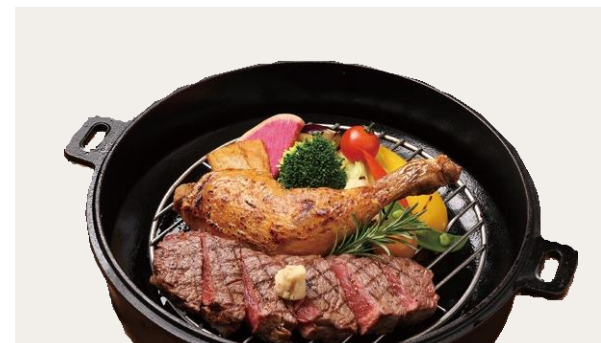
Roast chicken & Beef steak