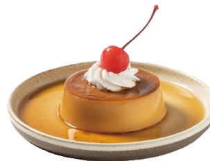
ノスタルジックな 昭和プリン 680 (748)