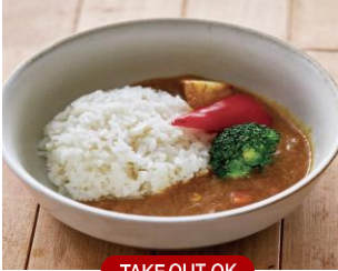
キッズプレート 980 (1,078)