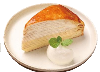
ダブルクリーム の ミルクレープ 580 (638)