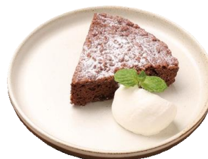
ブラウニーチョコケーキ 580 (638)