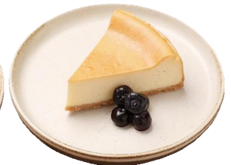
バイクドNYチーズケーキ 580 (638)